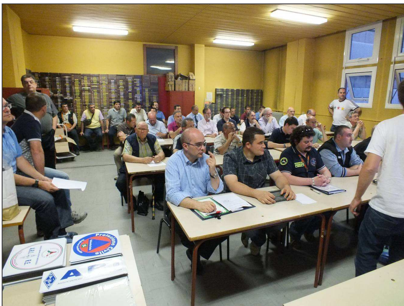
Un momento del briefing di martedì, 29 maggio scorso, presso la nostra Sezione

VII° INCONTRO MONDIALE DELLE FAMIGLIE – MILANO 2012