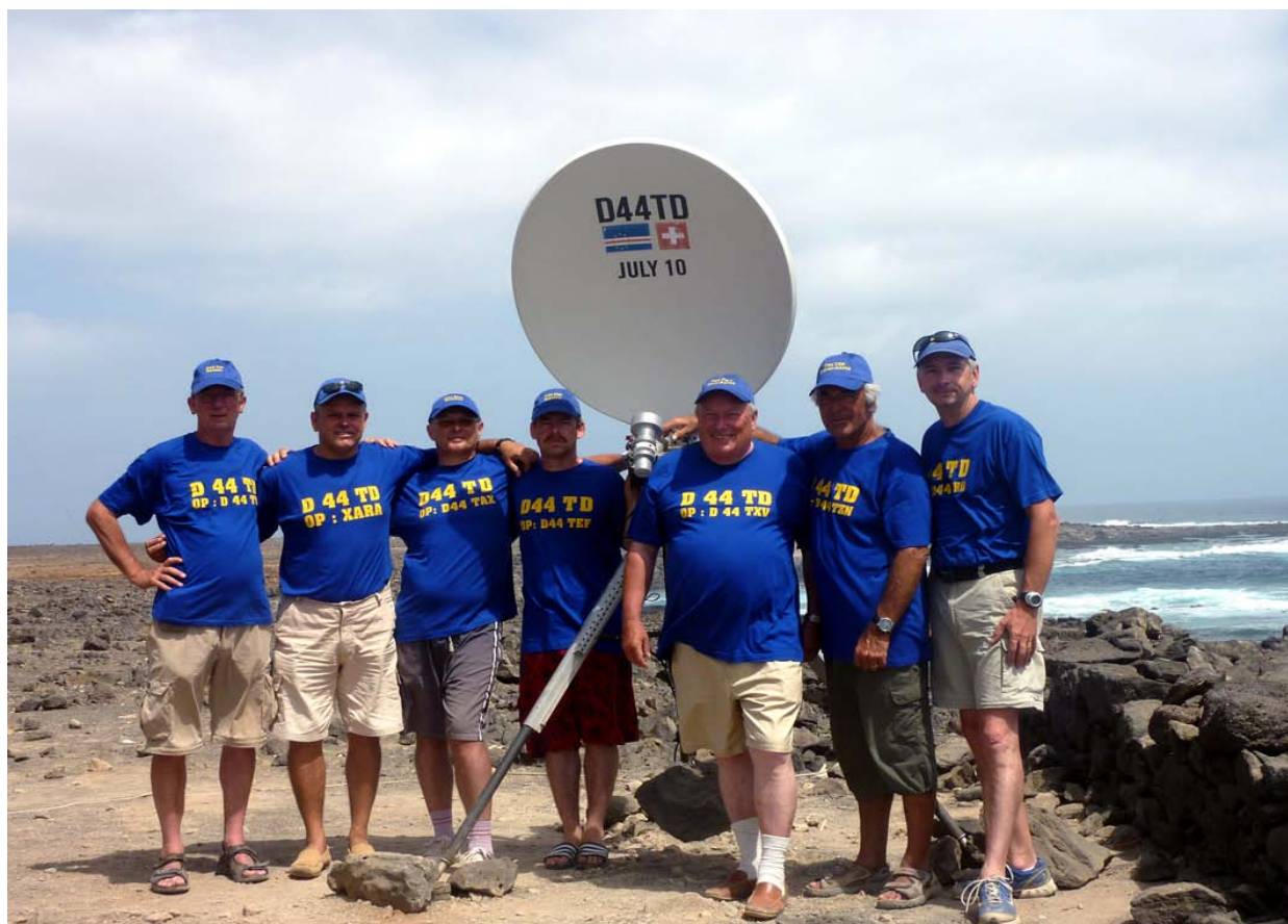
Il gruppo sull'isola di Capo Verde (D44...)

Stranamente è passata un po' in sordina questa notizia. Si tratta invece di una notevole performance risultato della bravura di un team di radioamatori svizzeri e francesi appassionati delle microonde, coadiuvati da OM di Capo Verde, Portogallo, Isole Canarie, Marocco e Madeira. Il team D44TD (Ile de Sal, Capo Verde) composto da HB9AYX/D44TAX, HB9AZN/D44TZN, HB9BOI/D44TOI, HB9EOF/D44TEF, HB9RHD/D44TRD e HB9RXV/D44TXV ed inoltre dal gruppo formato da CT7/F1PYR e CT7/F6DPH (Sines/Portogallo) sono riusciti il giorno 10 luglio 2010 alle 10:46 UTC a battere il record mondiale di distanza sui 10 GHz SSB, precedentemente detenuto da DJ3KM e da DJ4AM dall'anno 2000 (con QRB di 2079 km), stabilendo un contatto SSB con una nuova distanza di 2696 km. Questo record migliora il precedente di oltre 600 km!