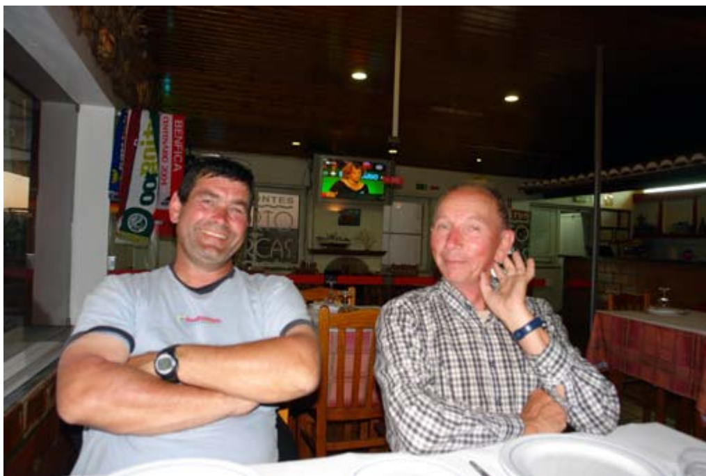
I corrispondenti a Sines, Portogallo (CT7/...)