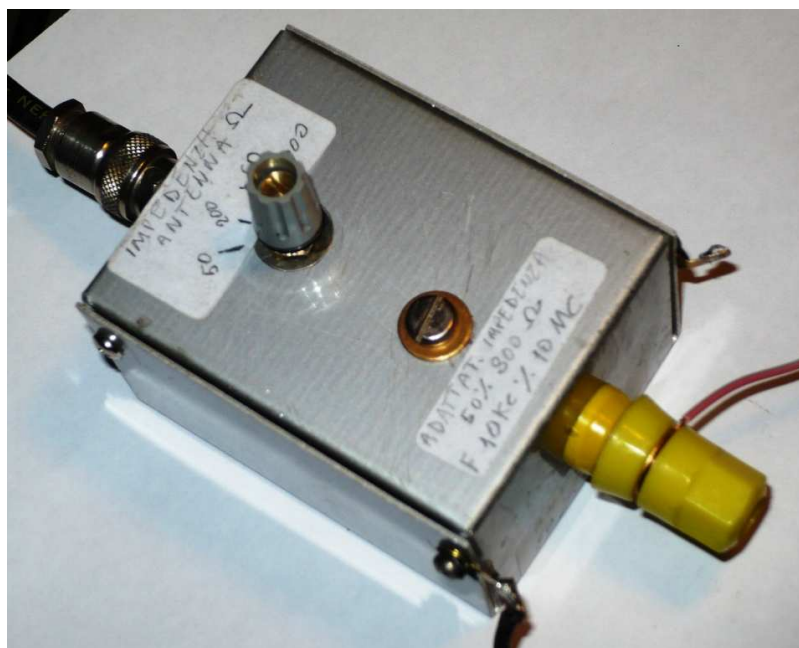
Vista della realizzazione (estremamente semplice)

Mi riferisco al precedente articolo sul filtro passa basso per completare il front-end in ricezione con un adattatore di impedenza per l'impiego soprattutto di antenne filari nella gamma onde lunghe e medio corte. Spesso disponendo di una filare proviamo ad inserirla nel connettore PL di antenna del ricevitore con risultati deludenti. Interponendo questo adattatore possiamo commutare la posizione più favorevole per una migliore ricezione. L'impiego è soprattutto indicato nelle zone con scarso QRN. In caso contrario è preferibile rinunciare a gran parte del segnale a favore della schermatura data da un cavo coassiale anche se l'elemento attivo è di piccole dimensioni.