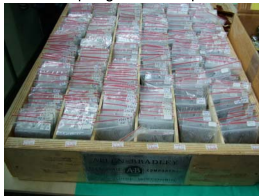
care e vecchie resistenze Bradley