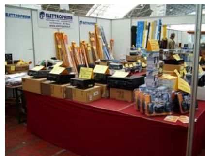
Finalmente radio ....

Eppure anche in questa occasione, non ostante la parte Silicon (PC et similia) la faccia ormai da padrone sulla parte Radiant (radio e componentistica) chi cercava ... trovava.