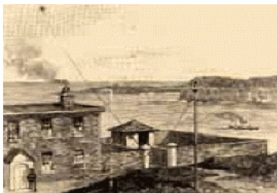
Sighill - Canada