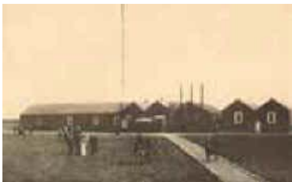
Poldhu – U.K.