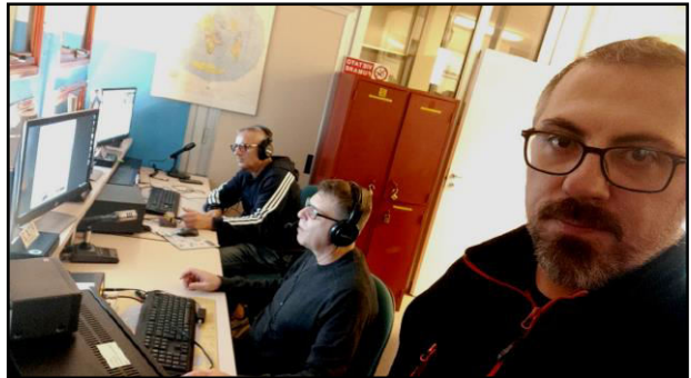
Il trio Iescano CIQ BMM BKC

E qui comincia la magia. Le bande si popolano di stazioni come mai sentirete nei giorni normali. Operatori, team da tutto il mondo saranno in aria ad ogni ora, giorno notte, via corta via lunga qualcosa troverete sempre. L'emozione di collegare VK ZL via lunga o la California Alaska Hawaii isole dei caraibi est asiatico, ti da quel fremito che non manca mai anche se questi paesi li hai già a log. La magia della propagazione regala sempre emozioni. Poi che dire quando colleghi una stazione di un altro paese e l'operatore ti risponde passandoti il rapporto nella nostra lingua, che sia un europeo dell'est, un italiano trasferito all'estero o figli di emigrati che orgogliosi delle loro radici ti parlano e ti salutano in italiano, operatori di tutto il mondo a cui scappa un "Buona fortuna" un "Ciao" e tu non puoi non contraccambiare, lo fai e basta. Lo so che i puristi e i big operatori delle grandi stazioni non sono contenti di questi saluti, ma si fanno e lo so che lo fate anche voi, perché è la magia dei contest e la fratellanza che c'è tra noi radioamatori. È così!!! Ci emozioniamo anche ad un "Buona fortuna" e ad un "Ciao", poi detto da un operatore straniero ci rende ancora di più orgogliosi. Le ore passano, gli operatori si alternano, c'è chi fa uno spuntino, chi dorme, chi va e chi viene, ma qualcuno è sempre alla radio e non è mai solo, perché due operatori ci sono sempre in aria, chi fa RUN e chi va a caccia di MOLTIPLICATORI.