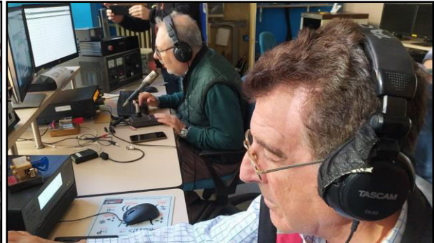
IZ2KEC e IK2GWH

A proposito dei famosi invasati da contest, c'è un aneddoto che vi voglio raccontare, ovviamente non vi dirò mai il nome neanche sotto tortura, ma è andata così. Il tutto mentre stavamo azzannando un salame. "Paolo io mi sono un po' rotto di fare i contest, non è che mi attirino più di tanto" rispondo "Si sì come no" "Paolo davvero!!!" ... dopo 5 minuti "Paolo ci dobbiamo svegliare, siamo sotto rispetto all'ultima edizione, forza dobbiamo dare un'accelerata, adesso vado in radio e spacco tutto" ... Ecco appunto. Quanto li adoro i "contestatori". Siamo gente strana ma innocua. Ma allora come è andata? Non starò qua a tediarvi con particolari sulla propagazione sulle bande ecc. ... chi ha fatto il contest come singolo operatore o operatore in altre stazioni sa cosa è successo, per gli altri, una foto vale più di mille parole.