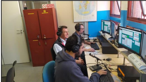
IZ2YJD IZ2KEC IU2CIQ