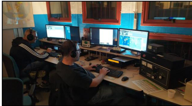
IZ2BKC e IU2CIQ la prima notte

Ma le 00.00 UTC si avvicinano e le cose si fanno serie. Si parte!!! Si abbassano le luci e fino a domenica ore 23.59.59 UTC, IQ2MI sarà in aria.