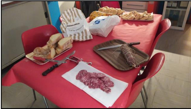
Spuntino di mezzanotte

fascino che solo chi fa contest nel turno di notte può capire. Ma non si vive di solo radio e a Milano siamo specialisti in libagioni. Quindi, via a preparare il tavolo con tovaglia e accessori vari. Sappiamo per esperienza diretta che un operatore non ben nutrito e adeguatamente idratato, è un operatore infelice, e soprattutto, porto a conoscenza dei Soci che in sezione abbiamo una suite confortevole con tutti i servizi per riposare dopo il turno alla radio.