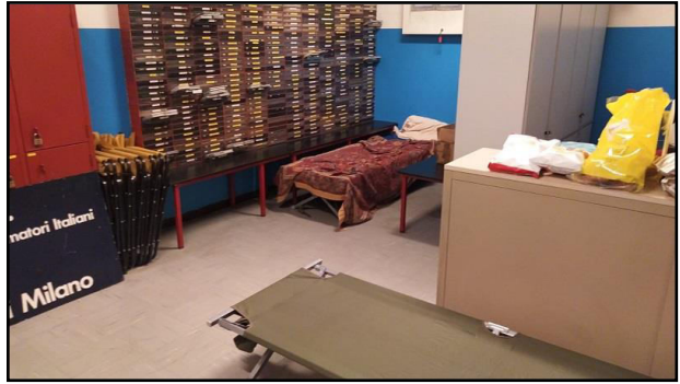
Suite ARI Milano

Ma le 00.00 UTC si avvicinano e le cose si fanno serie. Si parte!!! Si abbassano le luci e fino a domenica ore 23.59.59 UTC, IQ2MI sarà in aria.