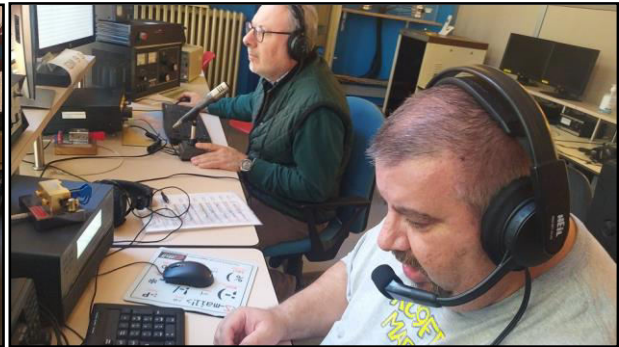
KC9FFV e IK2GWH