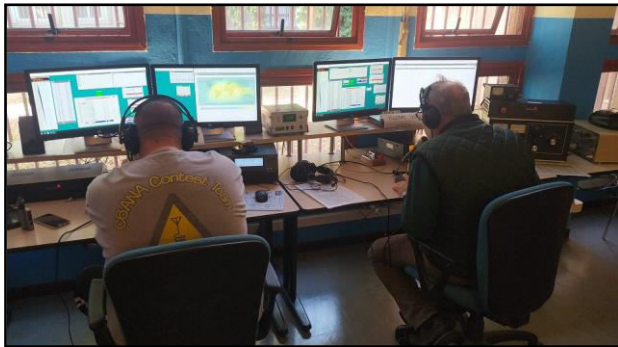
KC9FFV e IK2GWH

cercare moltiplicatori. Scopriremo molto presto se si è divertito o se si dato alla macchia impaurito dal manicomio che è un contest in sezione.