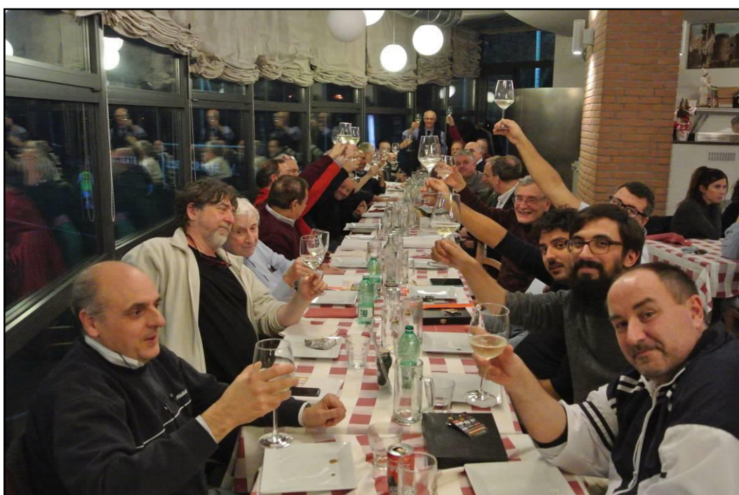
Il brindisi di Auguri dei Soci della Sezione A.R.I. di Milano