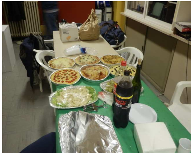
... qualcosa da mangiare ...