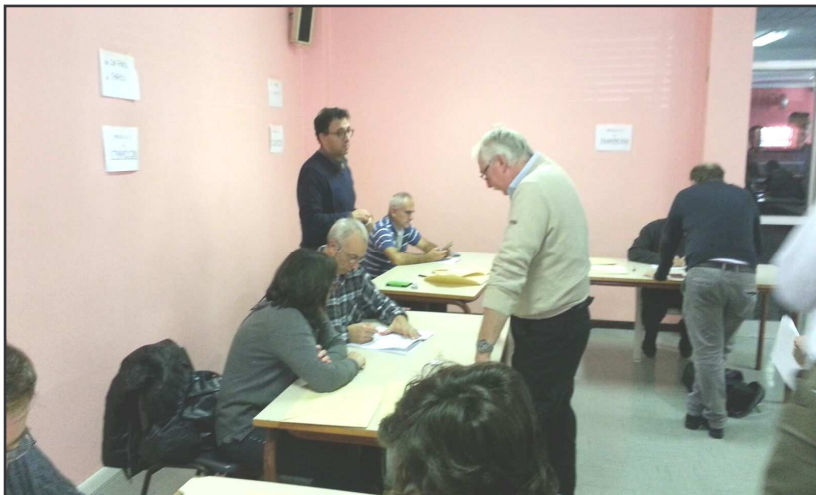
un momento della correzione di un elaborato